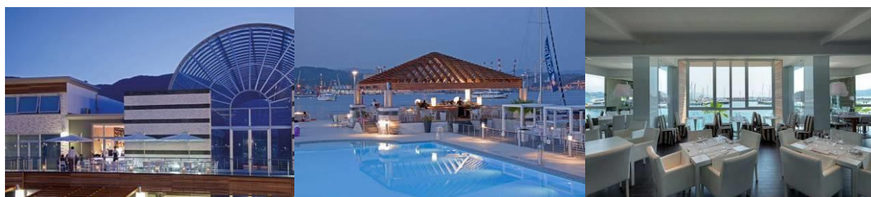
TABELLA PREZZI - 2019

Perfettamente inserito nel tessuto urbano, il Porto, offre inoltre la possibilità di usufruire di strutture legate al tempo libero, cultura, shopping e a tutti i servizi offerti dalla città.